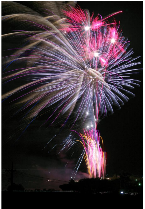
平成28年度 最優秀作品